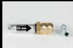
Luftdruckregler 23mm Art.Nr. ZU-071