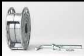
MONTI Aufnahmesystem, 23mm Art.Nr. AS-009