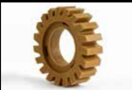
Vinyl Zapper® Art.Nr. ZU-010-01