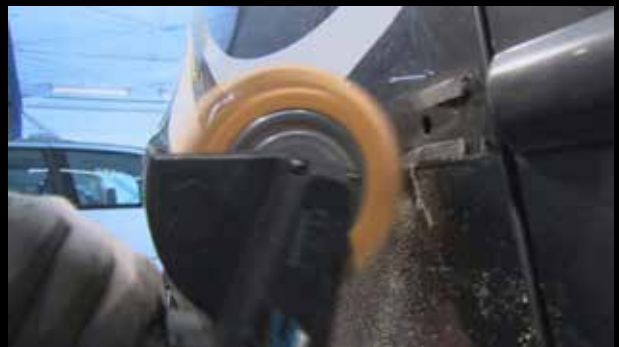
Entfernung von Klebstoffresten

Der Vinyl Zapper® wird mit einem MONTI Aufnahmesystem 23mm auf den Antriebsaggregaten MBX® Pneumatic oder MBX® Electric verwendet.