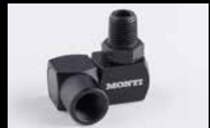
Drehgelenk für Luftdruck- Anschluss Art.Nr. ZU-073

MONTI - Werkzeuge GmbH Germany T +49 (0) 2242 9090 630 www.monti.de info@monti.de