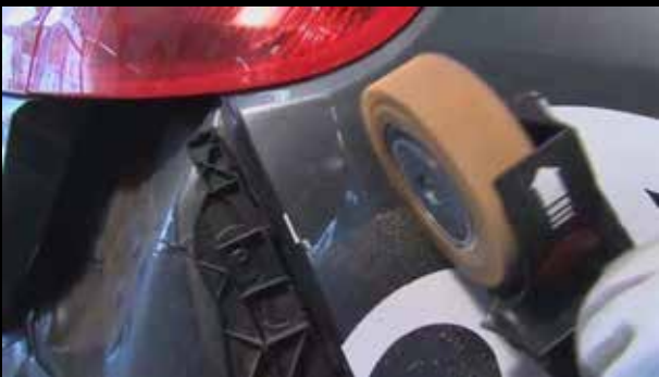
Entfernung von Fahrzeugbeschriftungen

Bedingt einsatzfähig ist der Vinyl Zapper® auf Wasserlacken, GFK, Plexi- und Acrylglas.